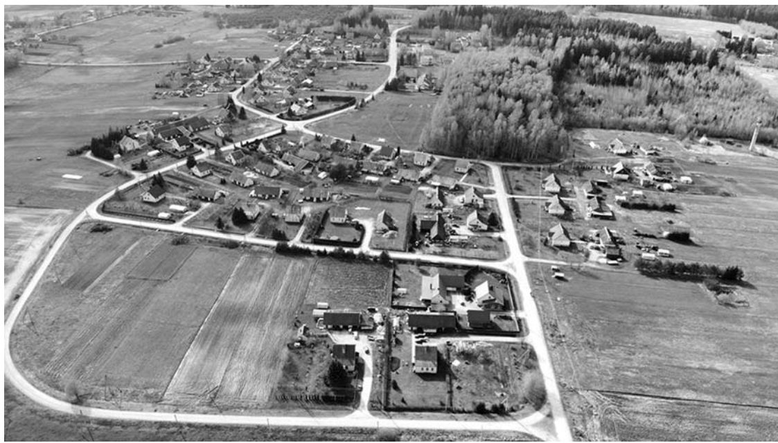
Leliūnų gyventojai dėl kaime tvyrančio sрутų kvapo skundžiasi jau nebe pirmą kartą.

Pirmadienį, rugsėjo 2 dieną, aplinkosaugininkams buvo pranešta apie kelias dienas Debeikių seniūnijos Leliūnų kaime tvyrančią sрутų smarvę. Nors pažeidimų nenustatyta, po pareigūnų patikrinimų blogi kvapai kaipmat išsisklaidė.