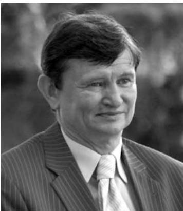
Sergejus JOVAIŠA, praityje garsus Lietuvos krepšininkas:

- Lietuvos vyrų krepšinio rinktinės rezultatai Pasaulio vyrų krepšinio čempionate labai prasti, čia net nėra apie ką diskutuoti. Niekas tokių rezultatų neplanavo. Lietuvos vyrų krepšinio rinktinė pagal sudėtį