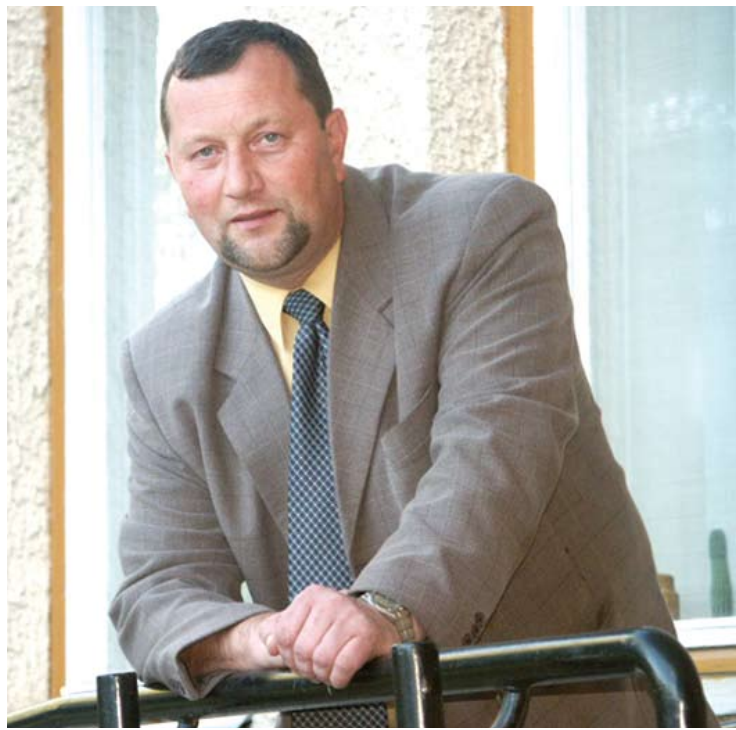
Eugenijui Pajarskui Anykščių rajono savivaldybės administracija išmokės solidžią kompensaciją.

Vidmantas ŠMIGELSKAS vidmantas.s@anyksta.lt